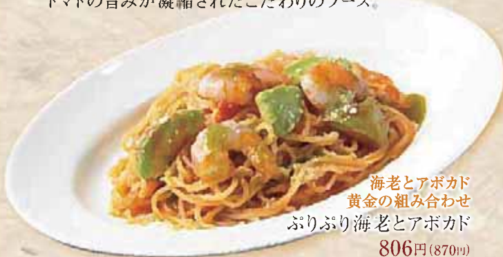
海老とアボカド 黄金の組み合わせ ぷりぷり海老とアボカド 806円(870円)