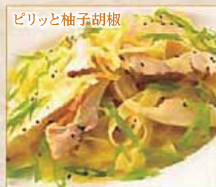
ピリッと柚子胡椒