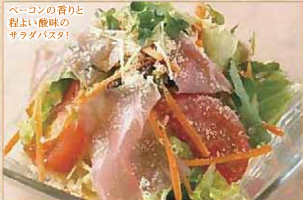
ベーコンの香りと 程よい酸味の サラダパスタ!