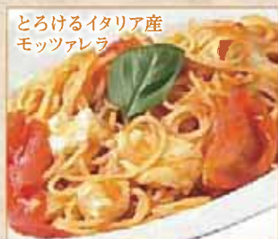
とろけるイタリア産 モッツアレラ