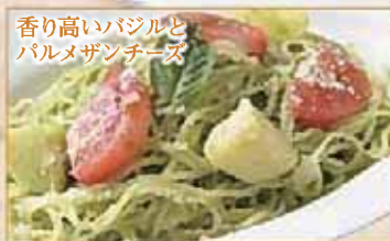
香り高いバジルと パルメザンチーズ