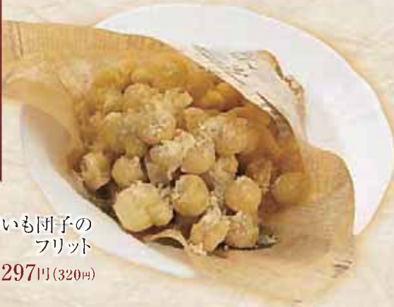
モチモチじゃがいも団子の フリット 297円(320円)