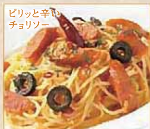
ピリッと辛い チョリソー