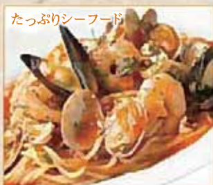
たっぷりシーフード