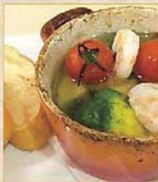
海老と野菜のabiesjo 770円(830円)