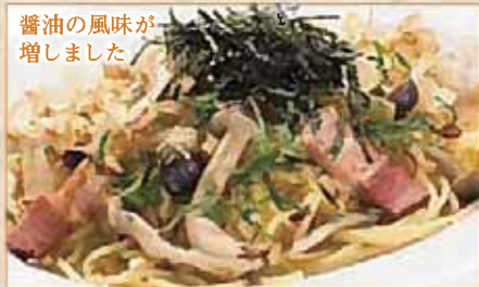
醤油の風味が 増しました