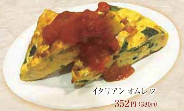
イタリアンオムレツ 352円(380円)