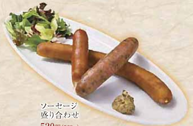
ソーセージ 盛り合わせ 520円(560円)