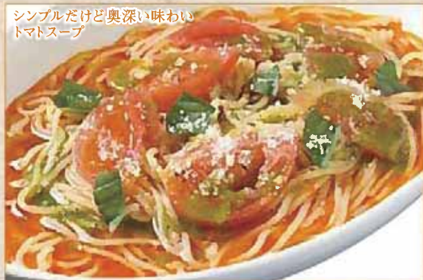
シンプルだけど奥深い味わい トマトスープ