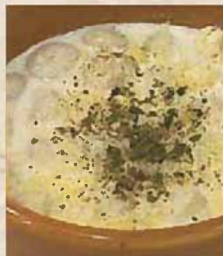
ゴルゴンゾーラのニョッキ 602円(650円)