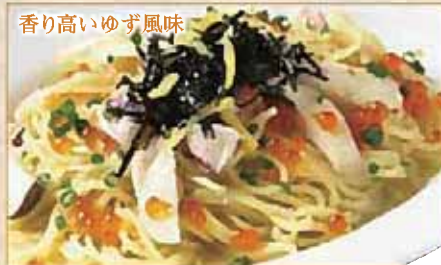
香り高いゆず風味