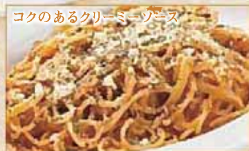
コクのあるクリーミーソース