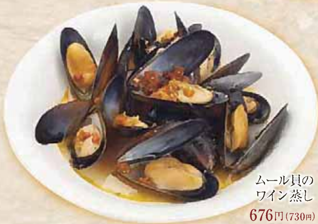
ムール貝の ワイン蒸し 676円(730円)