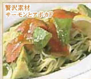
贅沢素材 サーモンとアボカド