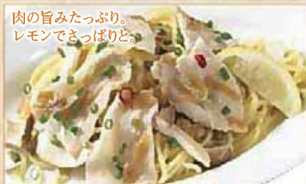
肉の旨みたっぷり。 レモンでさっぱりと。