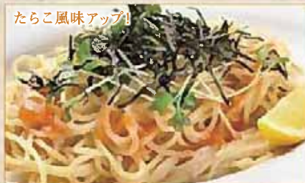
たらこ風味アップ!