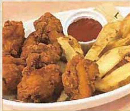
チキン&チップス 520円(560円)