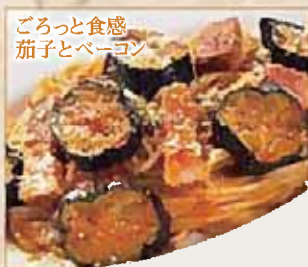
ごろっと食感 茄子とベーコン