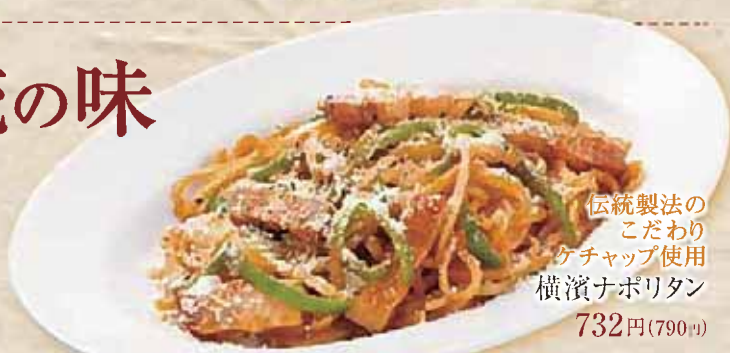
伝統製法の こだわり ケチャップ使用 横濱ナポリタン