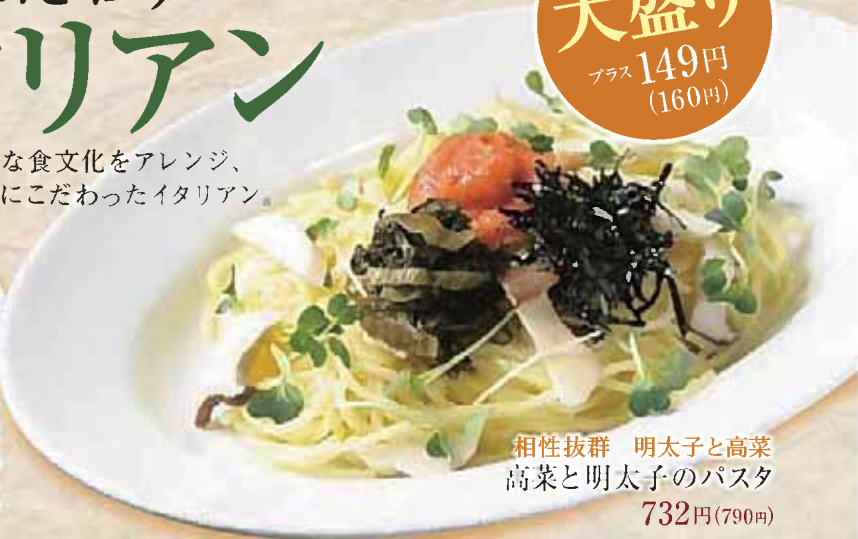
相性抜群 明太子と高菜 高菜と明太子のパスタ 732円(790円)