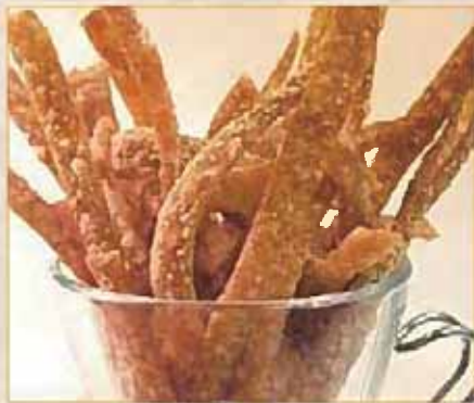
フライドフェットチーネ 352円(380円)