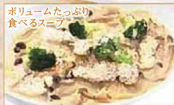
ボリュームたっぷり 食べるスープ