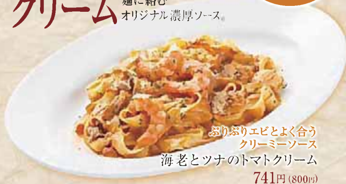
ぷりぷりエビとよく合う クリーミーソース 海老とツナのトマトクリーム 741円(800円)