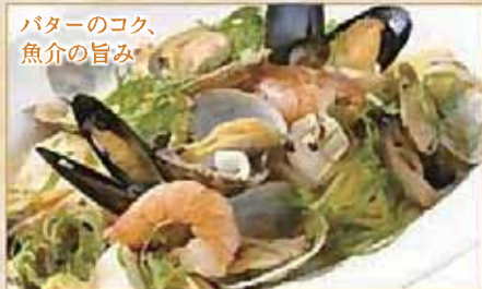
バターのコク、 魚介の旨み