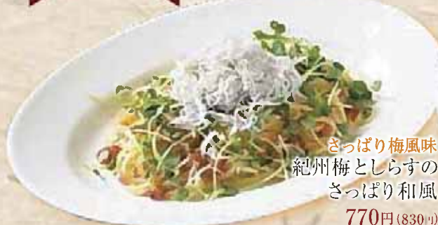
さっぱり梅風味 紀州梅としらすの さっぱり和風 770円(830円)