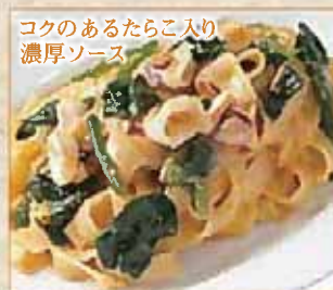
コクのあるたらこ入り 濃厚ソース