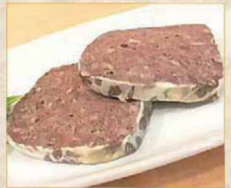
田舎風レバーパテ 602円(650円)