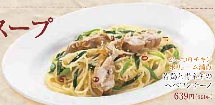
がっつりチキン ボリューム満点 若鶏と青ネギの ペペロンチーノ 639円(690円)