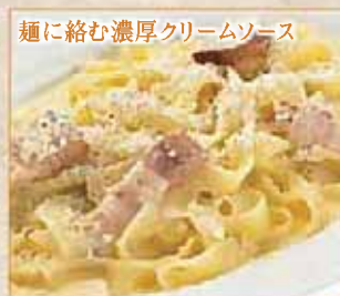
麺に絡む濃厚クリームソース