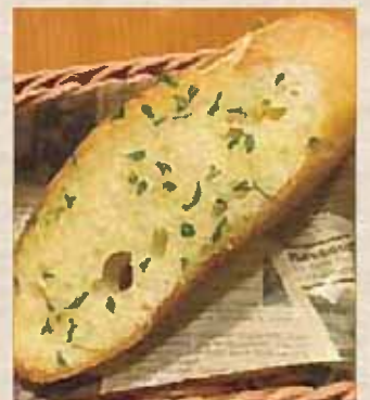
ガーリックバケット 139円(150円)