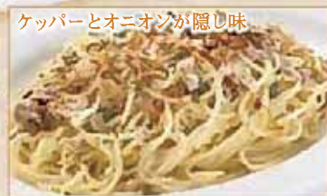
ケッパーとオニオンが隠し味