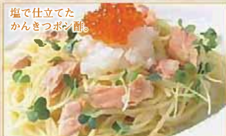
塩で仕立てた かんきつポン酢。